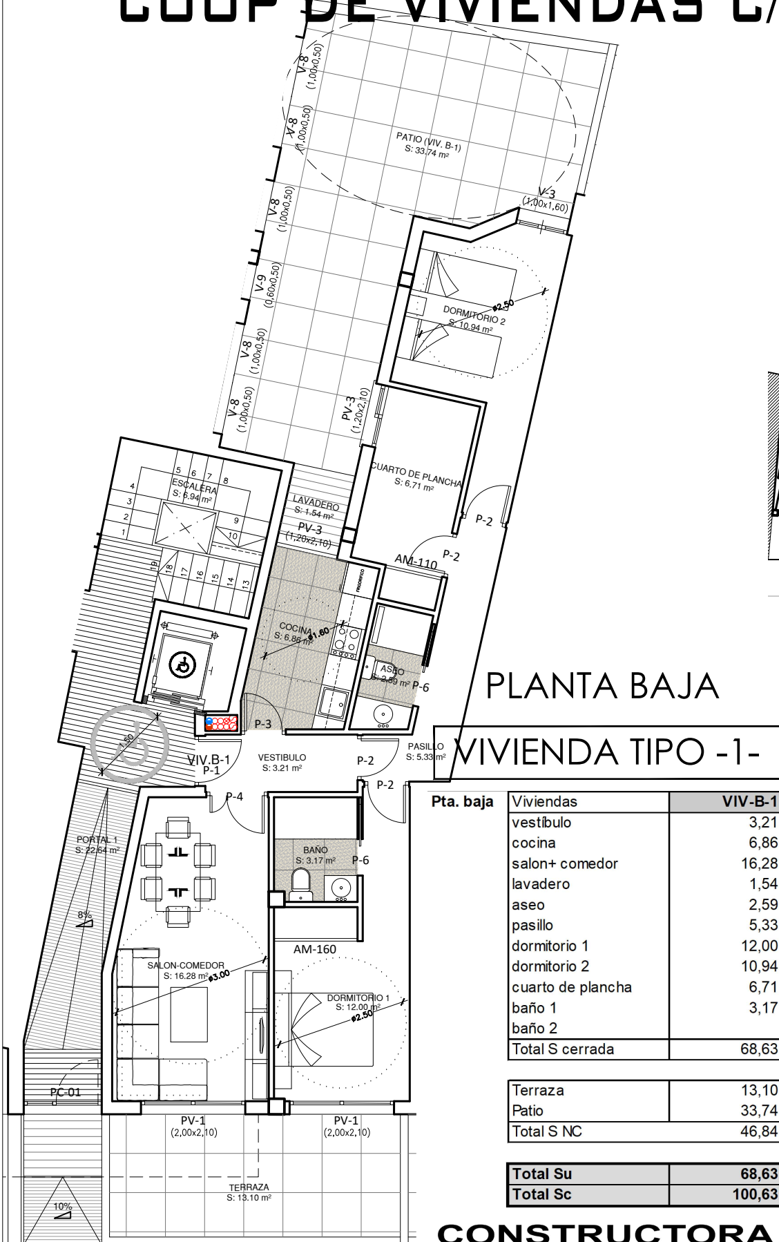
PLANTA BAJA VIVIENDA TIPO -1-