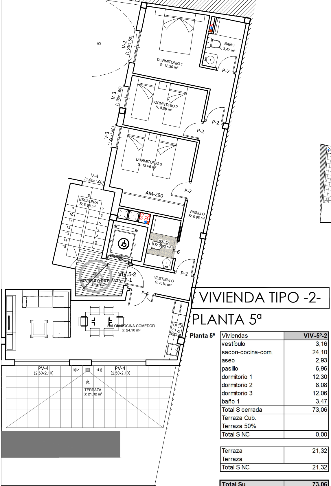
VIVIENDA TIPO -2- PLANTA 5ª